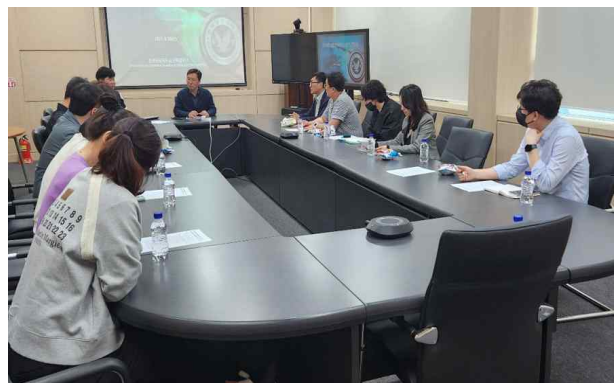
산학연 연계 사업 업무협의