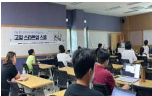
중부대·항공대·동국대 연계 전문인재양성 창업교육과정