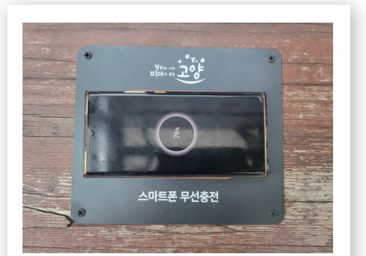
시민의 편의와 안정성을 고려한 스마트폰 무선충전기 설치

기성 충전기 제품들은 옥내형으로 제작되어 있어 눈과 비에 노출된 버스정류장 쉼터에 적용하기에는 어려움이 있었다. 또한, 타 시군에서 설치했던 유선 케이블을 이용한 스마트폰 충전기는 설치 당시에는 좋은 반응을 보였으나, 불특정 다수가 이용하고 케이블이 노출되어 있어 잦은 고장이 발생했다. 특히 충전기 고장의 95% 정도가 케이블에서 발생하였고, 그에 따라 지속적으로 충전 케이블을 교체해야 하는 등 유지관리에 어려움을 겪