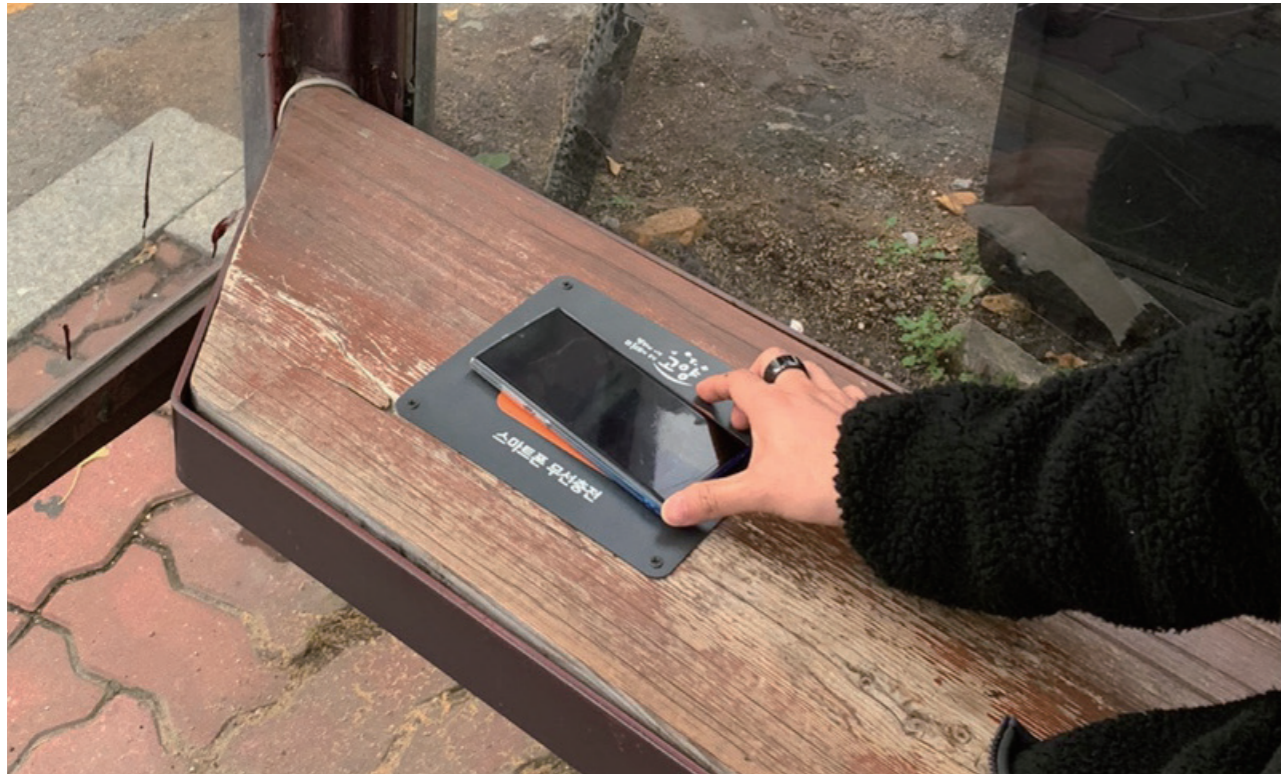
고양시 곳곳에 설치된 스마트폰 무선충전기