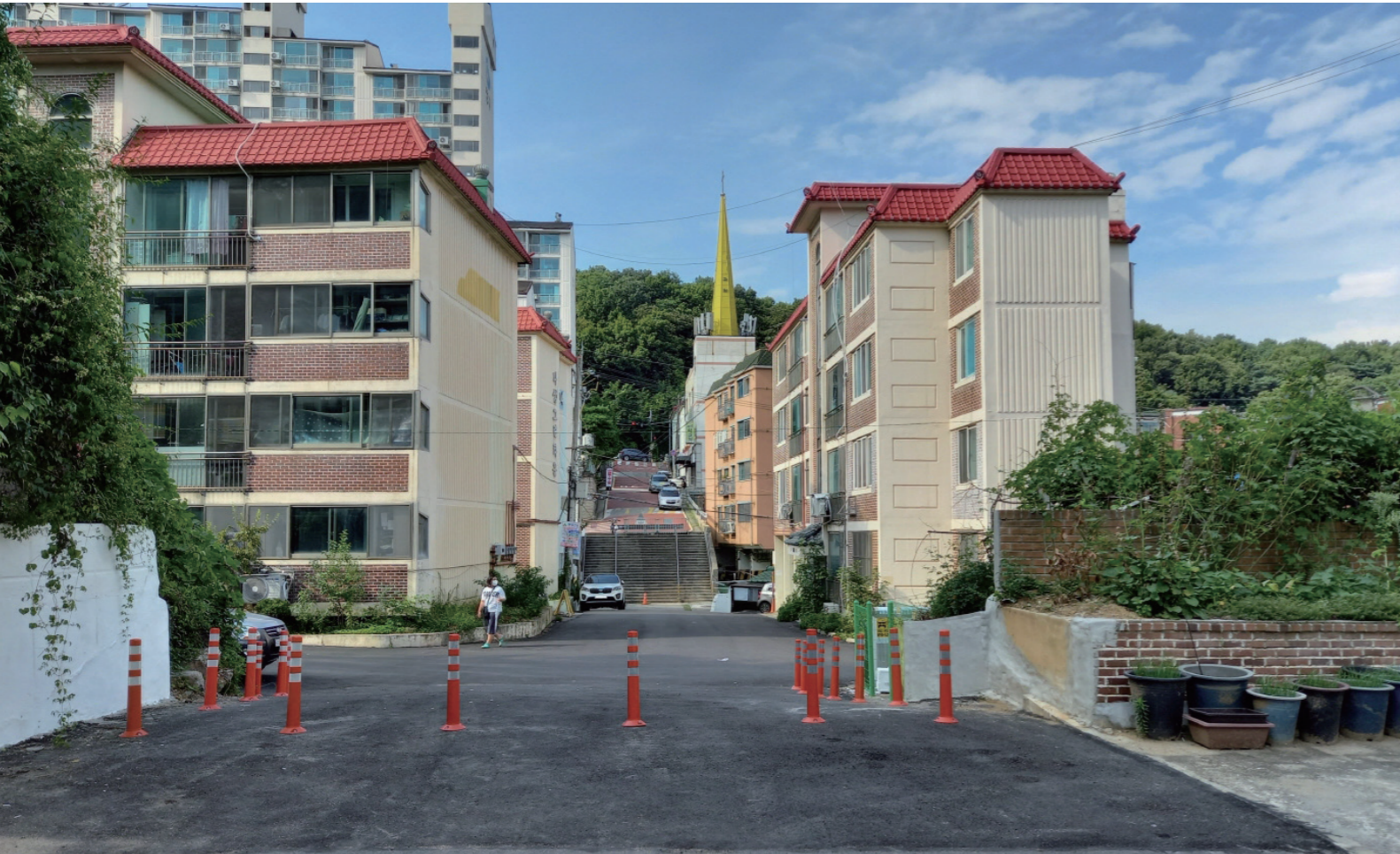
담장 철거 후 전경