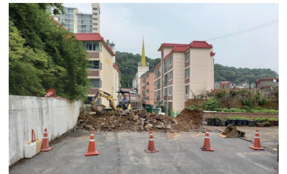
철거 당시 현장