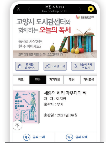
오늘의 독서 휴대전화 화면